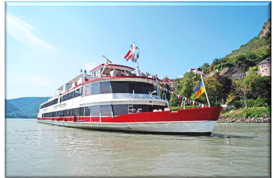
© MS Admiral Tegetthoff_Dürnstein - DDSG Blue Danube