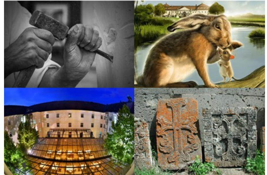
© pixabay, NÖ Landesausstellung, Altes Kloster